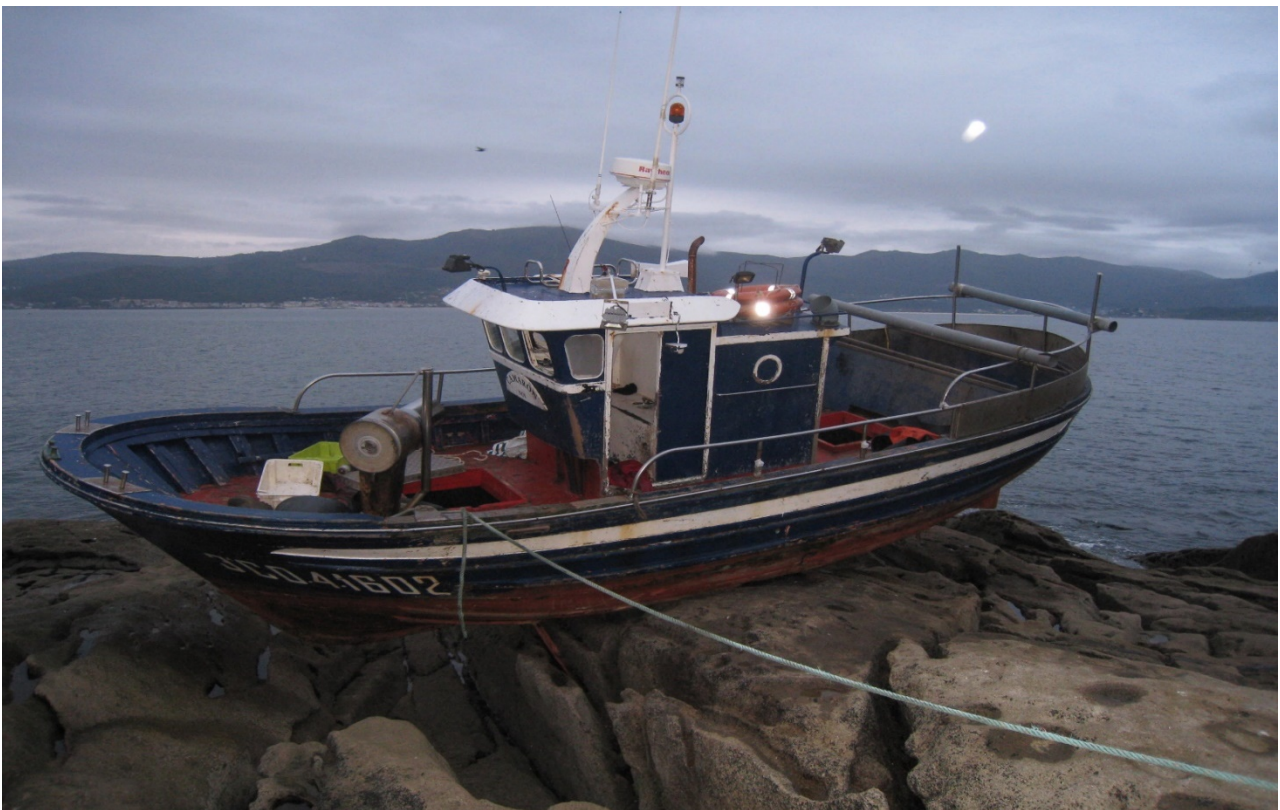
Figura 4. E/P CAMARÓN, encallada.