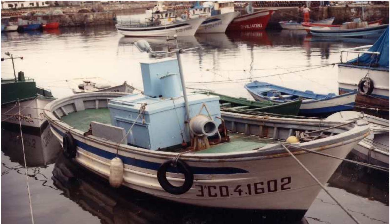
Figura 3. E/P CAMARÓN (fotografía del censo de flota pesquera operativa)

Pérdida de gobierno y posterior varada del pesquero CAMARÓN en la Ría de Muros y Noia (A Coruña), el 12 de diciembre de 2014, con resultado de pérdida total de la embarcación