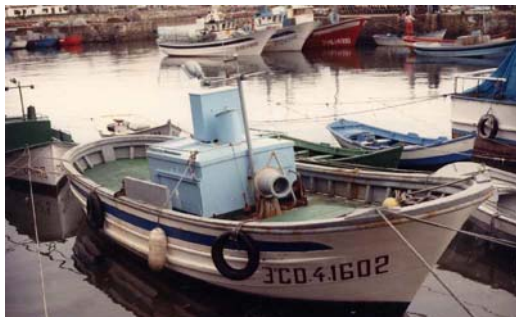
Figura 1. E/P CAMARÓN (fotografía del censo de flota pesquera operativa)

Pérdida de gobierno y posterior varada del pesquero CAMARÓN en la Ría de Muros y Noia (A Coruña), el 12 de diciembre de 2014, con resultado de pérdida total de la embarcación