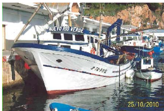
Figura 1. Pesquero NUEVO RIO VERDE