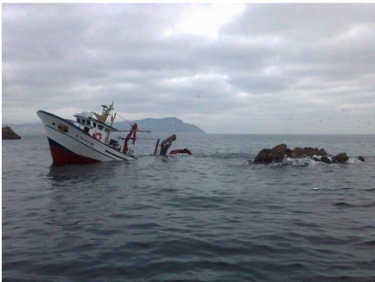
Figura 4. B/P NUEVO RIO VERDE tras la embarrancada

En torno a las 06:25 horas, el patrón, tal y como solía, realizó una llamada a la Cofradía de Pescadores de Sant Feliu y habló con un empleado de la lonja para comunicarle las capturas que llevaban a bordo. A partir de ahí, el AIS del pesquero comenzó a indicar una cierta caída hacia estribor, tomando un rumbo que lo dirigía hacia las Islas Hormigas.