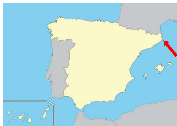
Figura 2. Zona del accidente