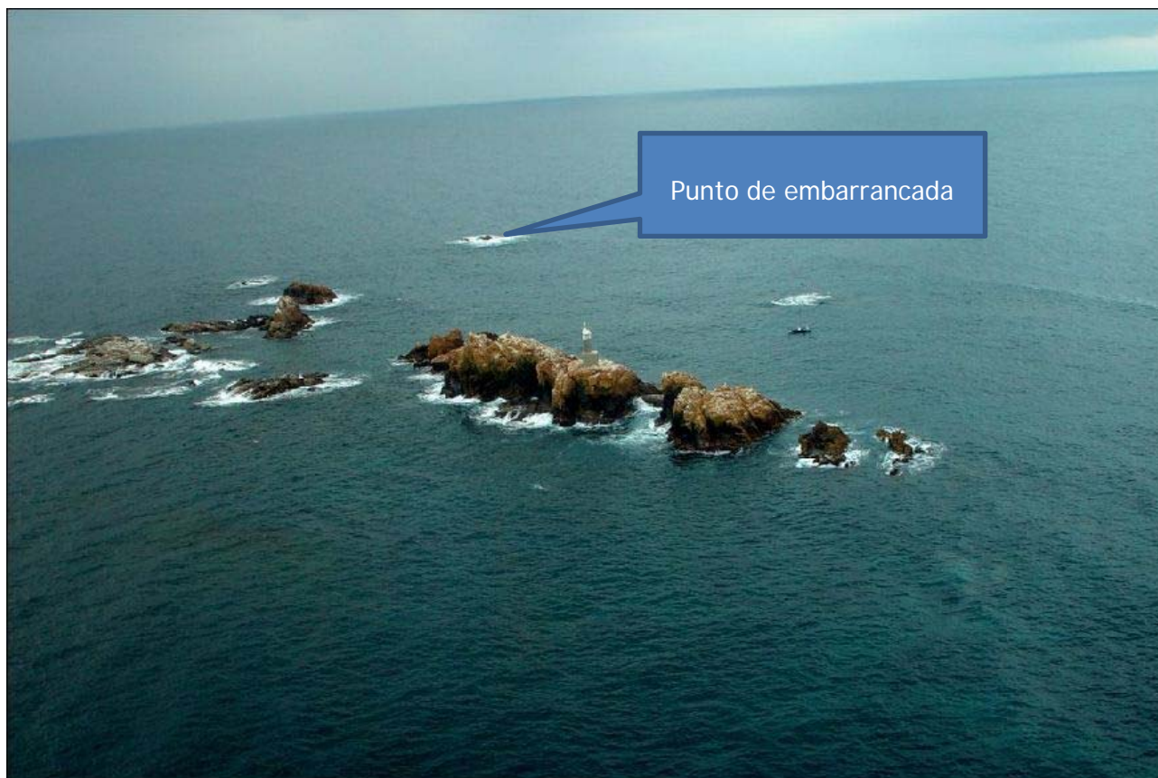
Figura 5. Islas Hormigas y punto de embarrancada

Las condiciones meteorológicas y la visibilidad eran buenas, según manifiesta el propio patrón, lo que le permitía ver el faro de las Islas Hormigas con total claridad.