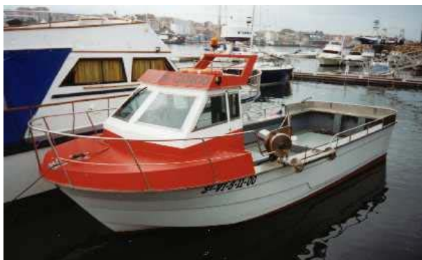
Figura 1. Embarcación UXUA CINCO