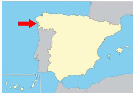
Figura 2. Zona del accidente