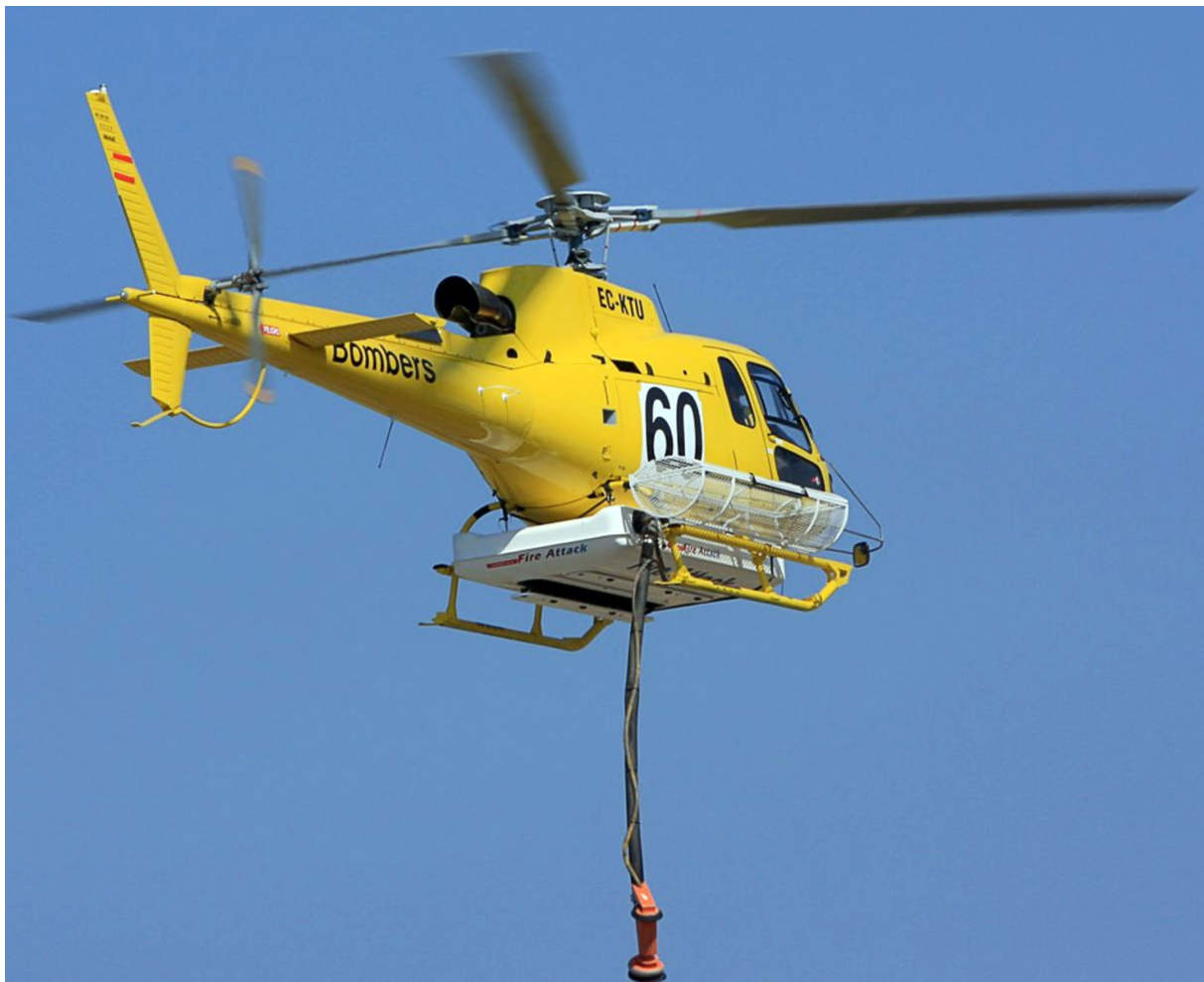
Figura 1. Conjunto de helicóptero y sistema de extinción Simplex 310

El helicóptero realizó dos periodos de vuelo en la extinción del incendio. El primer vuelo tuvo una duración de una hora y quince minutos y la tripulación realizó 17 cargas y