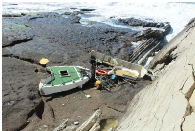
Figura 6. Restos de la E/P ILARGI SEGUNDO