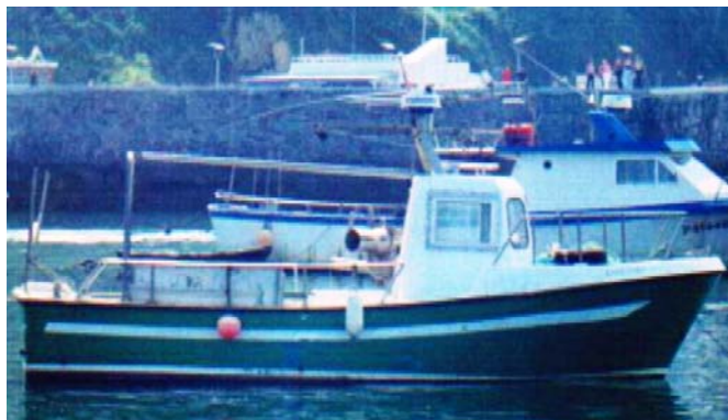
Figura 1. E/P ILARGI SEGUNDO

Accidente de la embarcación de pesca ILARGI SEGUNDO cerca de Getxo (Vizcaya), el día 13 de abril de 2018, con resultado de un fallecido y la pérdida de la embarcación