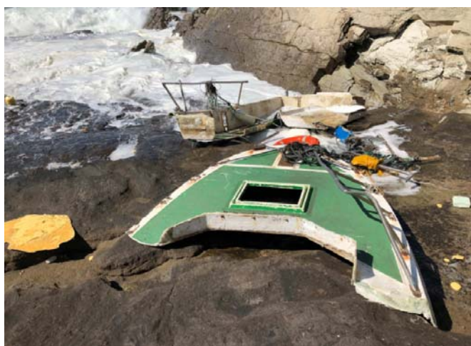
Figura 5. Restos de la E/P ILARGI SEGUNDO