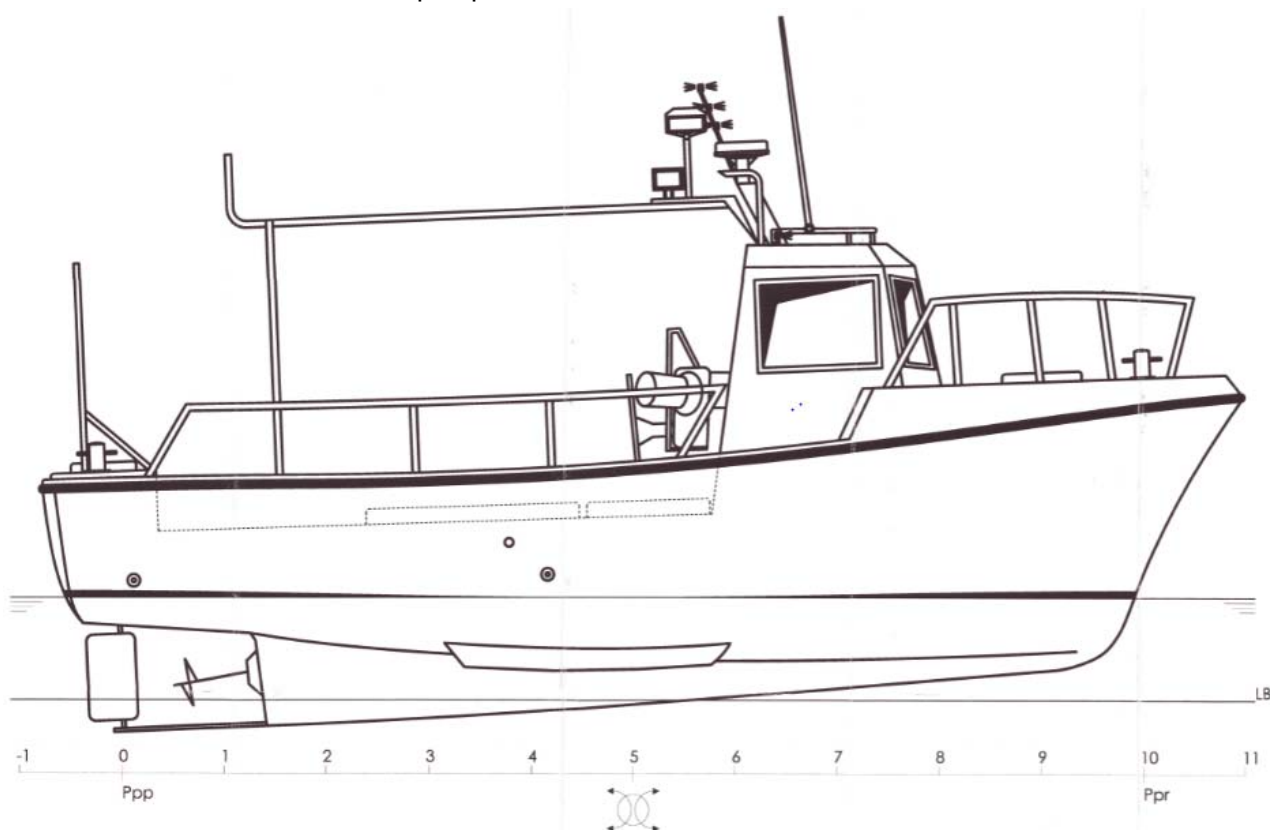
Figura 4. Plano de la embarcación ILARGI SEGUNDO.

La E/P ILARGI SEGUNDO era un pesquero de artes menores.