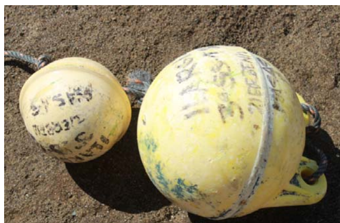
Figura 7. Arte recuperado perteneciente a la embarcación