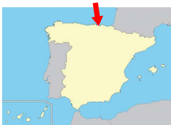
Figura 2. Zona del accidente